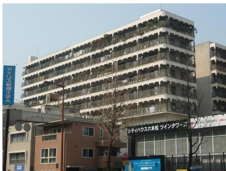
[外観・現況][外観写真]

■広々139.84平米の4LDKを3LDKにリノベーション！大濠公園が生活圏内、床暖房付き、利便性と良好な住環境を兼ね備えた物件です。