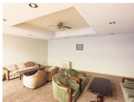
[共用部・設備施設][ロビー]